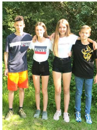
Das Streitschlichterteam der 5c

Aufgeteilt in vier Teams werden sie in den nächsten zwei Jahren als Paten und Streitschlichter für ihre Klassen da sein. Sie werden mit den fünften Klassen Aktionen durchführen, die die Klassengemeinschaft stärken sowie das Miteinander verbessern sollen, und werden in Konfliktfällen als Berater und Vermittler zur Seite stehen. Ait, Lie