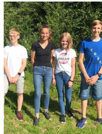
Das Streitschlichterteam der 5d

Wir möchten allen Prüflingen herzlich gratulieren. Rer