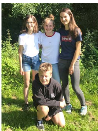
Das Streitschlichterteam der 5a

Im letzten Schuljahr zeigten sehr viele Schülerinnen und Schüler der Klassenstufe 8 Interesse an einer Tätigkeit als StreitschlichterIn, so dass wir für diese verantwortungsvolle und wichtige Arbeit 16 neue StreitschlichterInnen im Juli ausbilden konnten. Ihren ersten Einsatz hatten sie bei der Einschulungsfeier in der Stegwiesenhalle, wo sie jeder Fünftklässlerin und jedem Fünftklässler zur Begrüßung an unserer Schule einen Apfel und eine Brezel überreichten.