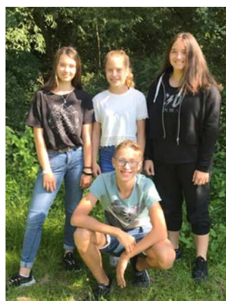
Das Streitschlichterteam der 5b